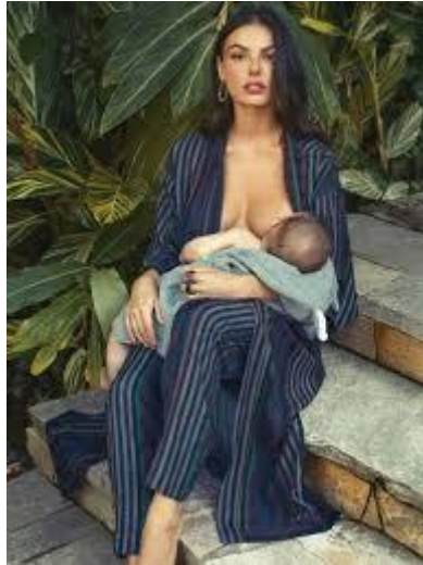
Figura 2 – Isis Valverde amamentado seu filho Rael