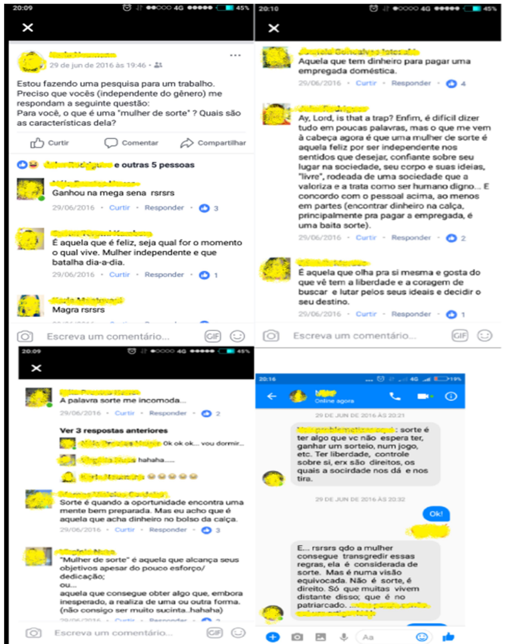
Imagem 2: perfil pessoal da rede social Facebook e aplicativo Messenger.

Obtivemos as seguintes respostas, agora transcritas: