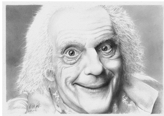
Dr. Emmett Brown